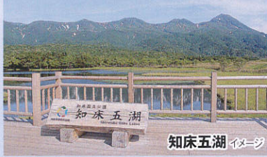
知床五湖 イメージ