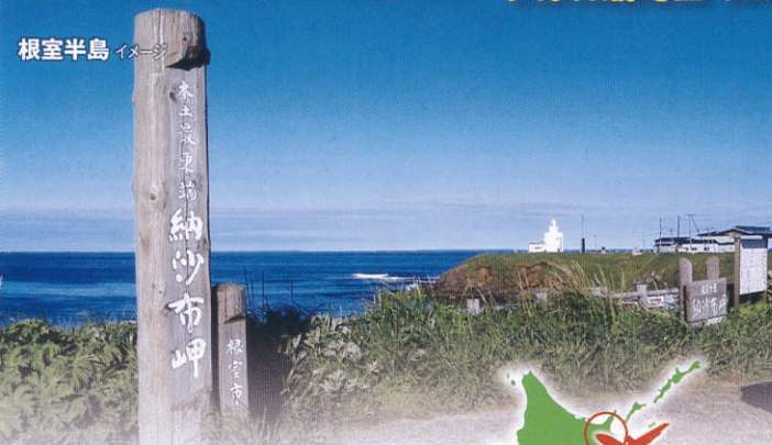
根室半島 イメージ