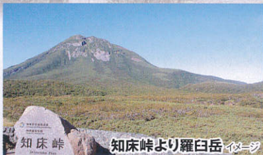
知床峠 知床峠より羅臼岳 イメージ