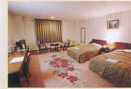
北館お部屋(洋室) イメージ