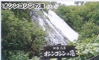
オシシヨシシの滝 イメージ 知床八景 オシシヨシシの滝