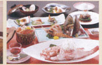
ご夕食(カムイ御膳) イメージ