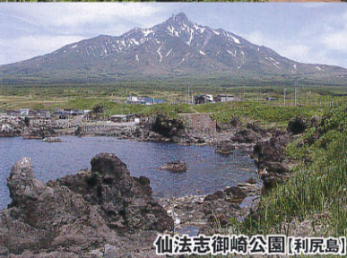
仙法志御崎公園【利尻島】