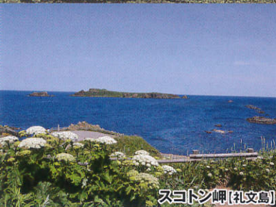
スコトシ岬【礼文島】