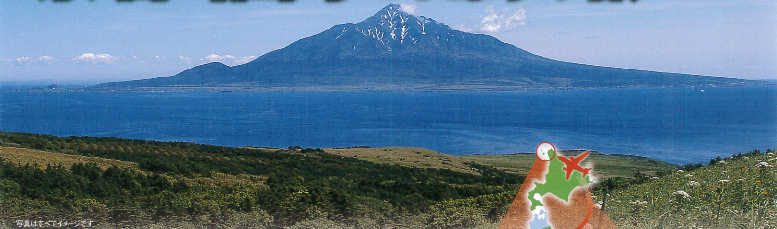
写真はすべてイメージです