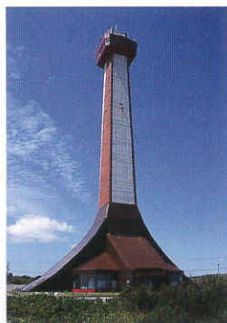
稚内市開基百年記念塔・北方記念館