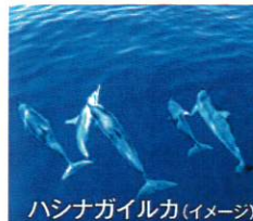
ハシナガイルカ(イメージ)