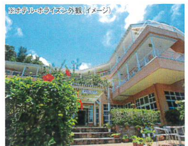
※ホテル・ホライズン外観(イメージ)