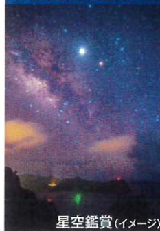
星空鑑賞(イメージ)