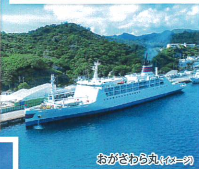
おがさわら丸(イメージ)