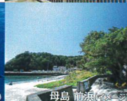
母島 前浜(イメージ)