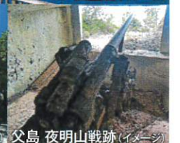
父島 夜明山戦跡(イメージ)