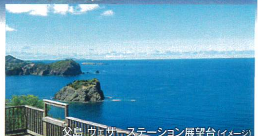
父島 ウェザーステーション展望台(イメージ)