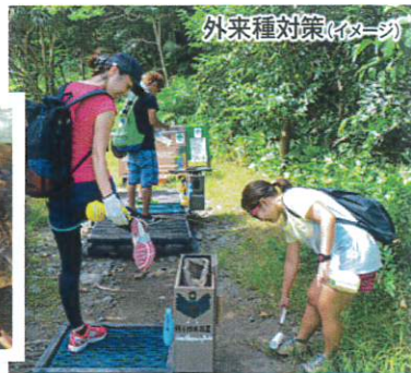
外来種対策(イメージ)