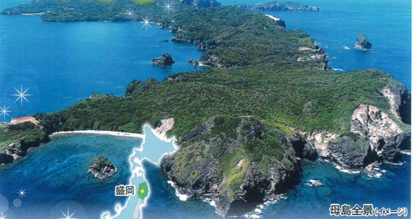
母島全景(イメージ)