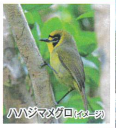
ハハジマメグロ(イメージ)