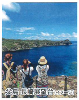
父島 長崎展望台(イメージ)