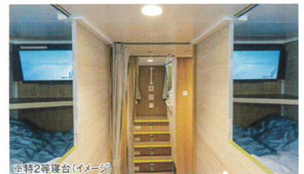
※特2等寝台(イメージ)

※左記料金には燃油調整金概算を含みますが、乗船日の2ヶ月前に発表される料金に変更が生じた場合は、その差額をお支払いいただけます。 ※室数に限りがございます。お早めにご連絡ください。その他不明な点はお申込窓口まで。