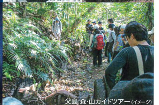
父島 森・山ガイドツアー(イメージ)