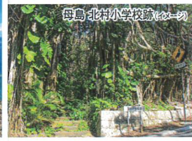
母島北村小学校跡(イメージ)