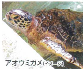
アオウミガメ(イメージ)

・ボニブルーと呼ばれる小笠原特有の青色に包まれるマリンタイムです。その色彩と景観を存分にお楽しみいただける人気のツアーですが、当日の気象、海況によっては、設定自体を取止め又は設定後でも催行中止及び行程変更となる場合もございます。催行中止・変更等に係る判断は全て船長が行います。また、このツアーは、小型ボートで外洋に出るため、かなりの船体動揺を伴います。ご参加を検討される際には予めご注意ください。オプションツアーについては、現地でご添乗員から詳しくご説明いたします。