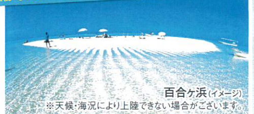
百合ヶ浜(イメージ) ※天候・海況により上陸できない場合がございます。