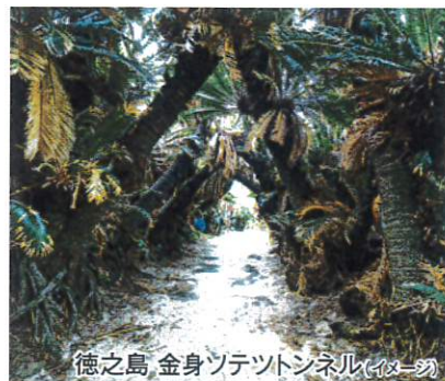
徳之島 金身ツテツトンネル(イメージ)