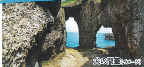
波で浸食された岩の景勝地「犬の門蓋」

〔島内観光〕・なくさみ館・泉重千代翁之像・犬布岬・犬の門蓋・ウンブギ ・サンセットビーチ・ムシロ瀬・金見ソテツトンネル・畦プリンスビーチ