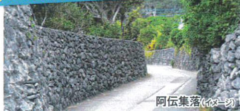
サンゴを積み重ねた石垣「阿伝集落」

〔島内観光〕・スギラビーチ・七島鼻・阿伝集落(サンゴの石垣)・澁集落 ・雁股の泉・ムチャ加那の碑・シュガーロード・百之台国立公園