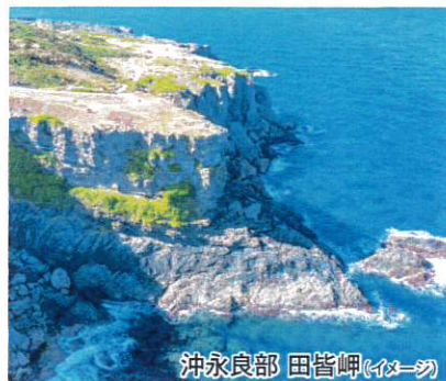
沖永良部 田皆岬(イメージ)