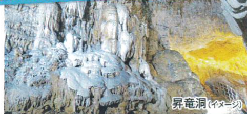
圧倒的なスケールが展開する「昇竜洞」

〔島内観光〕・笠石海浜公園・日本一のガジュマル・フーチャ海岸・ウジジ浜 ・大山植物公園・昇竜洞・田皆岬・世之主の墓・西郷南洲記念館