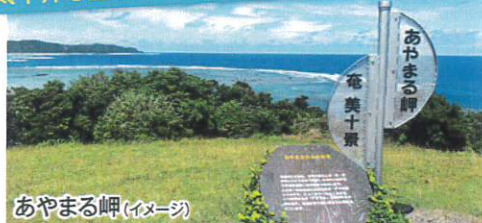
太平洋を望む大パノラマに感動!「あやまる岬」