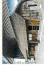
場所も大きさも当時のまま残っています。今も残る生家