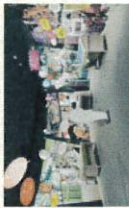
英世の形手を体験できるユーザー