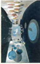
知れば知るほど面白い細菌の世界

野口英世が研究した細菌は、ふだんは目に見えない小さいものです。形や生態など様々な特徴を持つ細菌の不思議な世界を映像やワイドなどでわかりやすくご紹介いたします。また、細菌の培養など英世が培った細菌の世界をゲームやタッチパネルで体験しながら学ぶことができます。